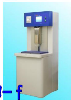
スタックマスター f