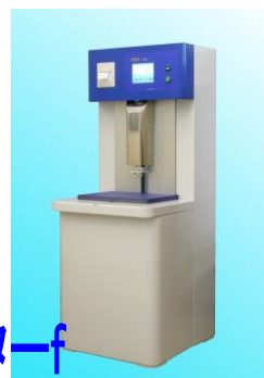
スタックマスターf