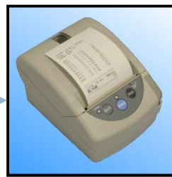
サーマルプリンタ